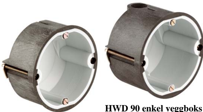
HWD 90 enkel veggbox - dyp

Dersom en brann skulle oppstå , vil det integrerte brannhemmende middelet umiddelbart reagere. Materialet vil svulle og fungere som en sikker tetning av installasjonsåpningen i brannveggen. Selv om det skulle være installert en tilsvarende boks på motsatt side av veggen, og uten noen form for ekstra forsterkninger i veggen, vil B90-veggen opprettholde sine strukturelle egenskaper.